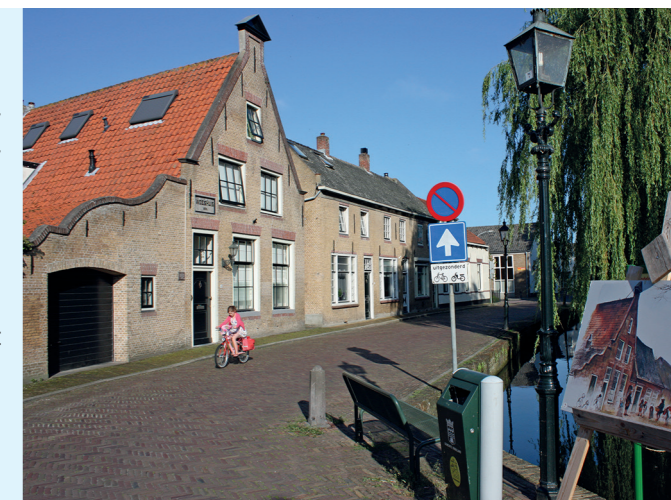
De wandeling gaat ook langs het weeshuis.