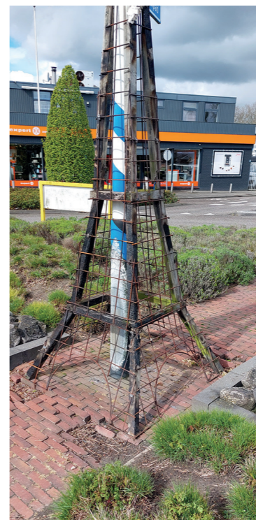
De huidige Eiffeltoren in Klein Parijs.

De plannen zijn gepresenteerd tijdens de vergadering van de dorpsraad op 9 april.