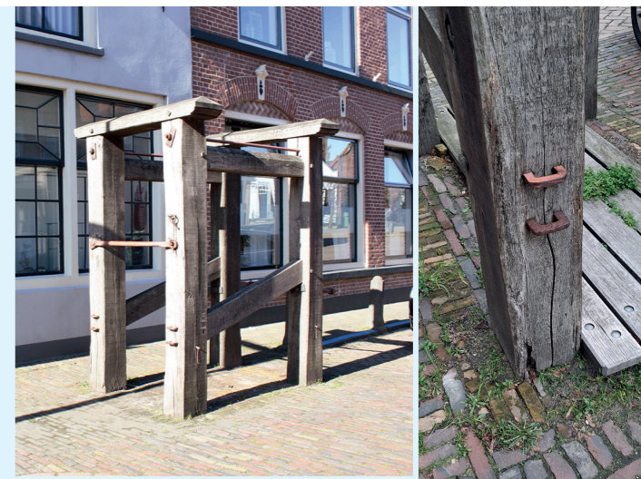
De travalje in de Voorstraat krijgt een opknapbeurt.

Tijdens de uitvoering van de werkzaamheden zal ook de travalje (stal voor het beslaan van paardenhoeven) worden hersteld. Voor de planning is de gemeente afhankelijk van Stedin. Hopelijk is de start in 2027.