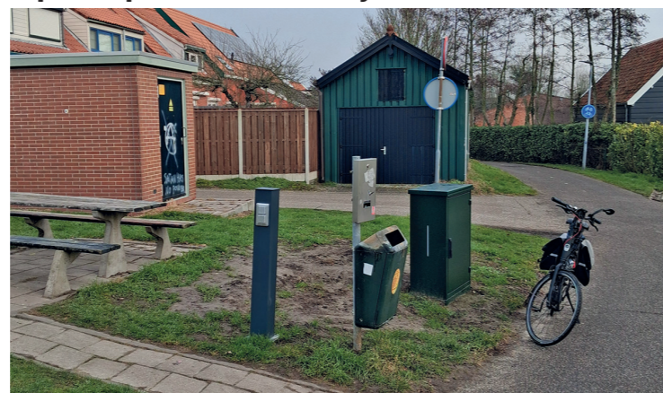
De oplaadpaal staat er.

De gemeente heeft inmiddels een oplaadpaal aangebracht bij de zitplek nabij de rotonde Korteweegje, Boomvliet, Schelpenpad. Deze blijkt echter nog niet te zijn aangesloten op het elektriciteitsnet. Het wachten is op Stedin. Hopelijk is de aansluiting voor het voorjaar gerealiseerd.