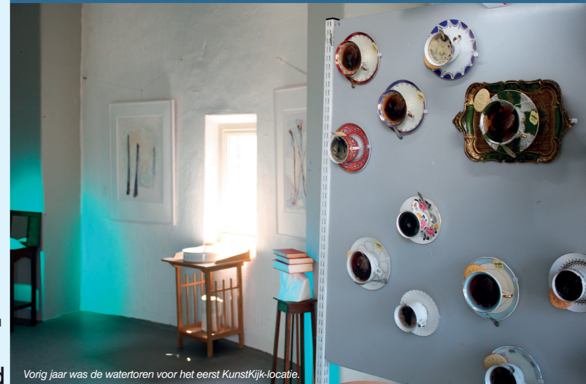
Vorig jaar was de watertoren voor het eerst KunstKijk-locatie.